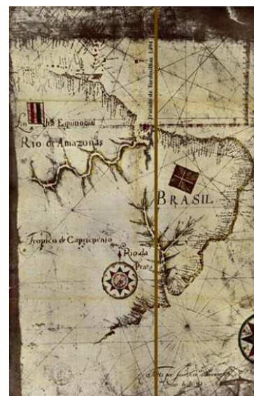
Figura 1: Mapa Tratado de Tordesilhas 1494

Designado assim por ter sido assinado em castelhana de Tordesilhas, foi assinado em 7 de Junho de 1494 pela Castela (Espanha) e por Portugal, estabelecia limites dos territórios descobertos chamados "Novo Mundo" entre os dois países durante a expansão marítima. Este tratado foi em atendimento pelo Papa ao pedido feito pela Espanha assim que Cristóvão Colombo descobriu a América. Portugal, não aceitou a decisão e ameaçou entrar em guerra contra os espanhóis. Após duras negociações o Tratado de Tordesilhas foi assinado. O Tratado permaneceu válido até 1750, quando os portugueses começaram a avançar e, portanto, a descumprir o que fora tratado em Tordesilhas, para as terras a oeste quando então passou a vigorar o princípio uti possidetis 5 , a terra pertencia a quem a ocupasse.